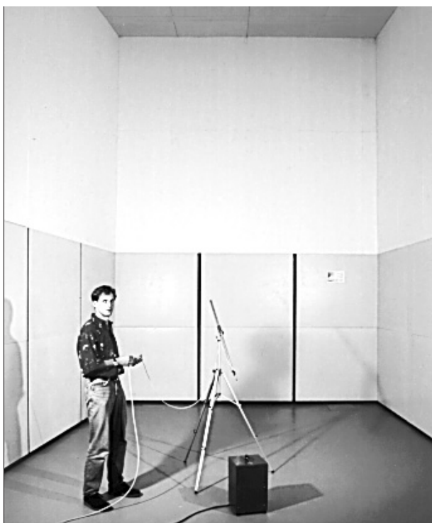
Bild 1: Photographische Aufnahme des neuen reflexionsarmen Halbfreiefeldraumes des IBP.

Klassische reflexionsarme Räume werden mit Absorberkeilen ausgestattet, die eine untere Grenzfrequenz von 80 bis 125 Hz ermöglichen. Die Tiefe dieser Keile liegt im Bereich von ca. 0,7 bis 1,0 m. Im Zuge der Entwicklung von Schallabsorbem bei tiefen Frequenzen [1, 2] entstanden Breitband-Kompakt-Absorber, die sich durch eine geringere Bautiefe von 0,25 m und durch eine glatte Oberfläche auszeichnen. Mit solchen Absorbem aus Melaminharzschaum mit eingeklebten Stahlblech-Tafeln wurde ein reflexionsarmer Halbfreiefeldraum im IBP eingerichtet, der Freifeldbedingungen von 20 Hz bis 16 kHz auf einer Halbkugeloberfläche bis zu einem Radius von ca. 2 m um die Schallquelle ermöglicht (Bild 1).