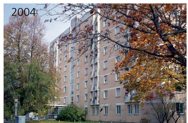
Bild 1: Ansicht der Westfassade vom Objekt 16 in München, 4 Jahre (1989) und 19 Jahre (2004) nach dem Aufbringen des WDV-Systems ohne zwischenzeitliche Renovierung. Das Dämmsystem blieb funktionsfähig ohne technische Mängel.

de Renovierung beseitigt worden sind. Die Ergebnisse der Bewertungen Ende 2004 sind folgendermaßen zusammen zu fassen.